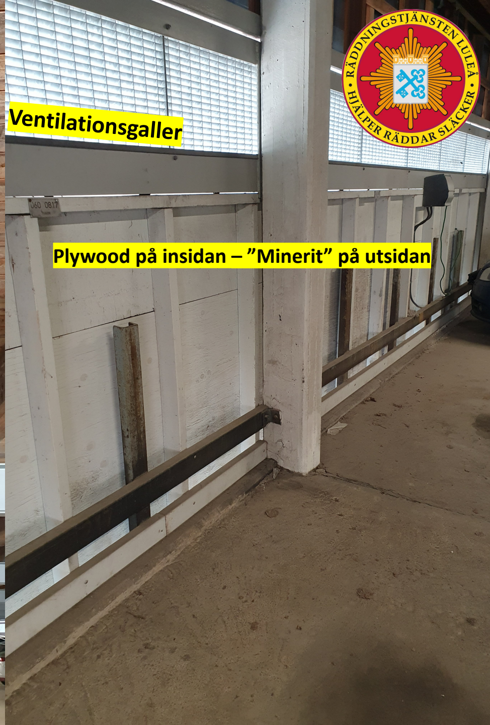
Plywood på insidan – "Minerit" på utsidan