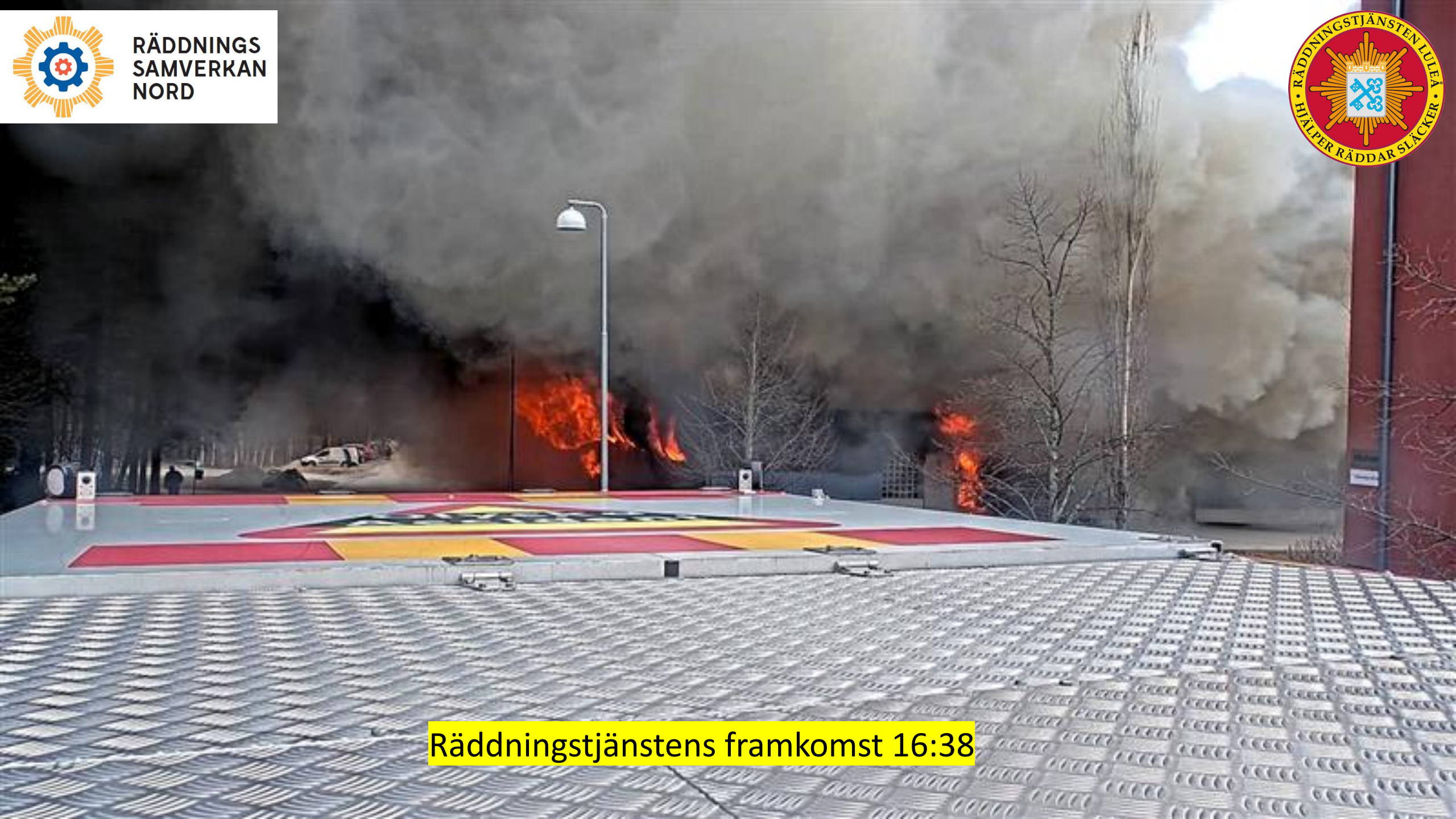
Räddningstjänstens framkomst 16:38