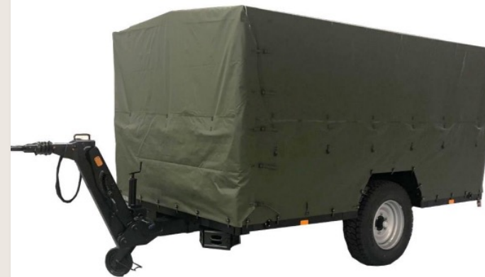
WTC 3200 GT