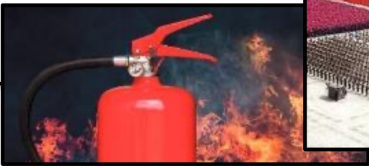
Ett kompetent släckförsök!

En strukturerad utrymning och återsamling!