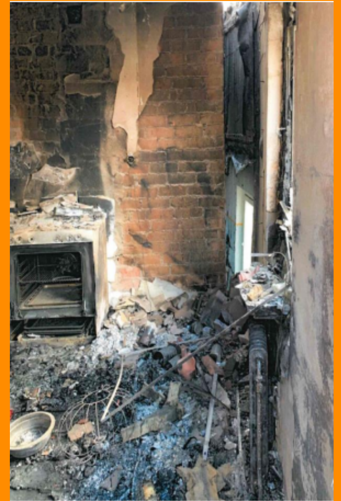
Från kök till trapphus