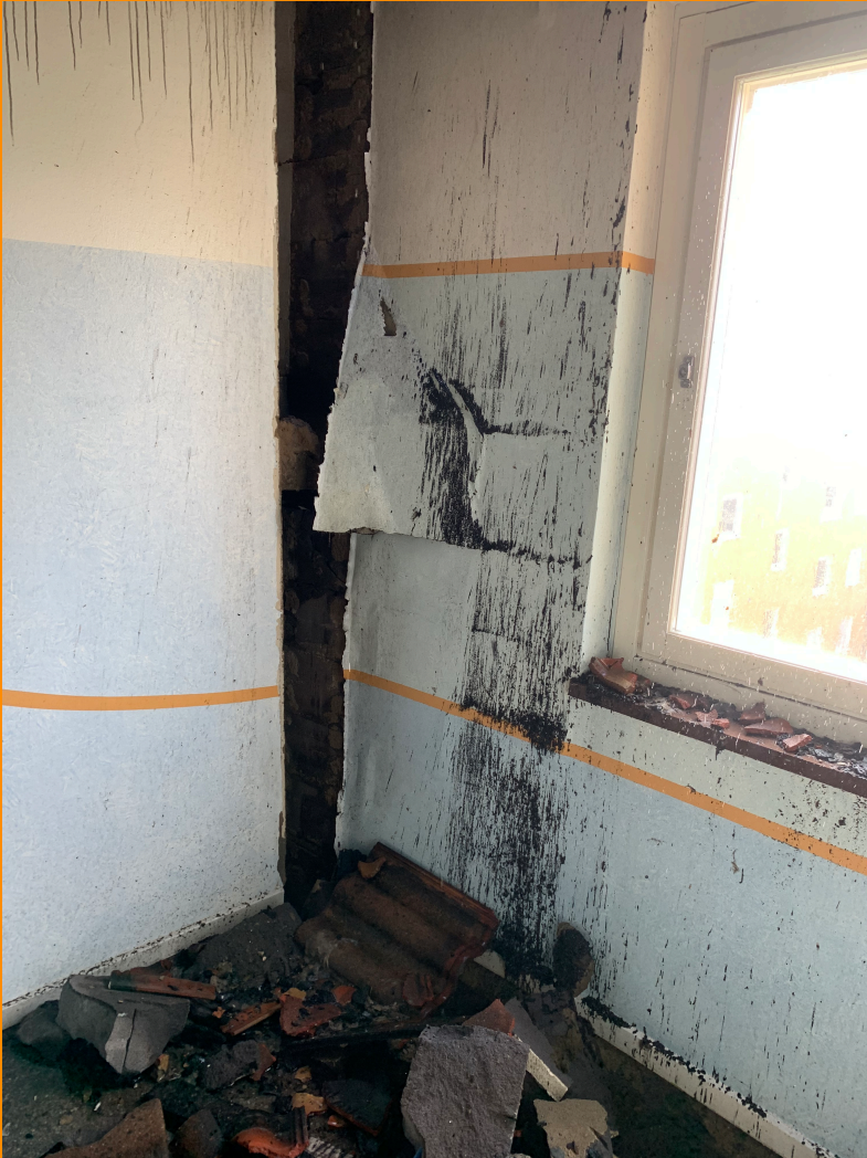
Vägg i trapphus